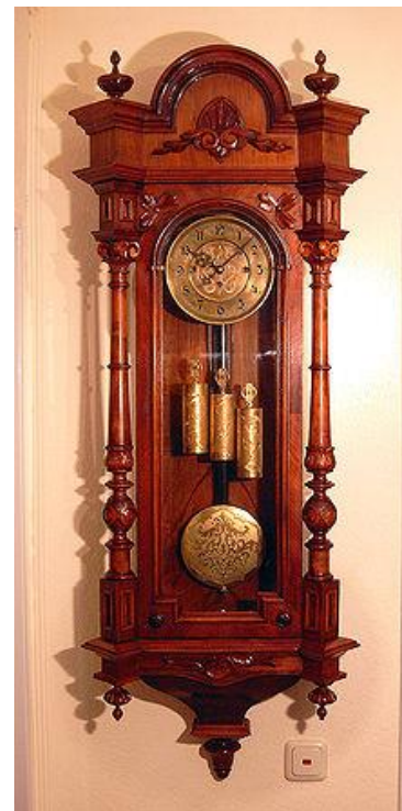
Obr. 5: Kyvadlové hodiny